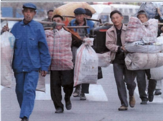
Pékin – 2004. « Travailleurs flottants » transportant leurs biens à Pékin. La population flottante en Chine approcherait les 100 millions de personnes.